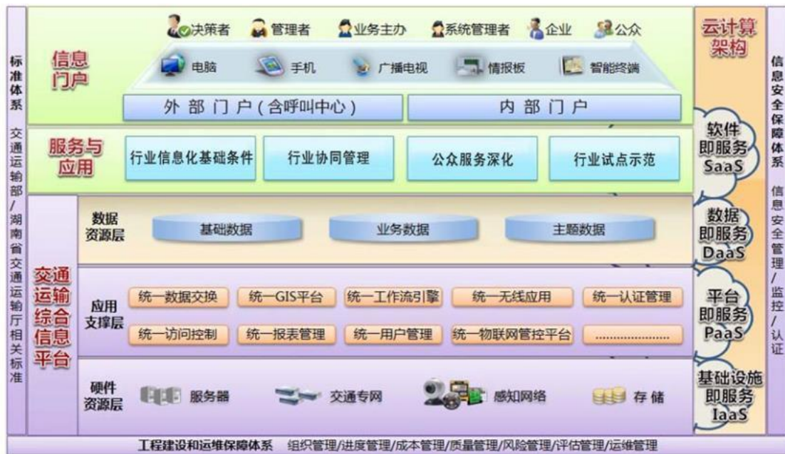
交通运输信息化“十三五”发展总体构架

“十三五”期间，在继续推进公路水路安全畅通与应急管理系统、公路水路建设与运输市场信用信息服务平台、交通运输物流信息平台、高速公路信息化工程等“十二五”交通运输信息化重点项目的基础上，开展行业信息化基础条件建设工程、行业协同管理工程、公众服务深化工程、行业试点示范工程四类建设工程（高速公路信息化具体建设任务详见省高速公路信息化“十三五”建设规划）。总体框架见下图。