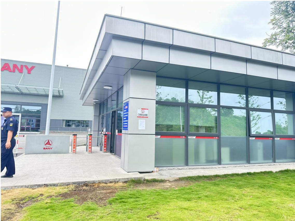
图 3 二次现场张贴公示