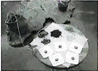
7月15日,岳阳即将入伏,作为“冬病夏治”治疗方法之一的三伏贴,一直很受市民欢迎。记者从岳阳市中医医院了解到,该院2024年“冬病夏治”正式启动,三伏贴开贴在即,市民预约火爆。