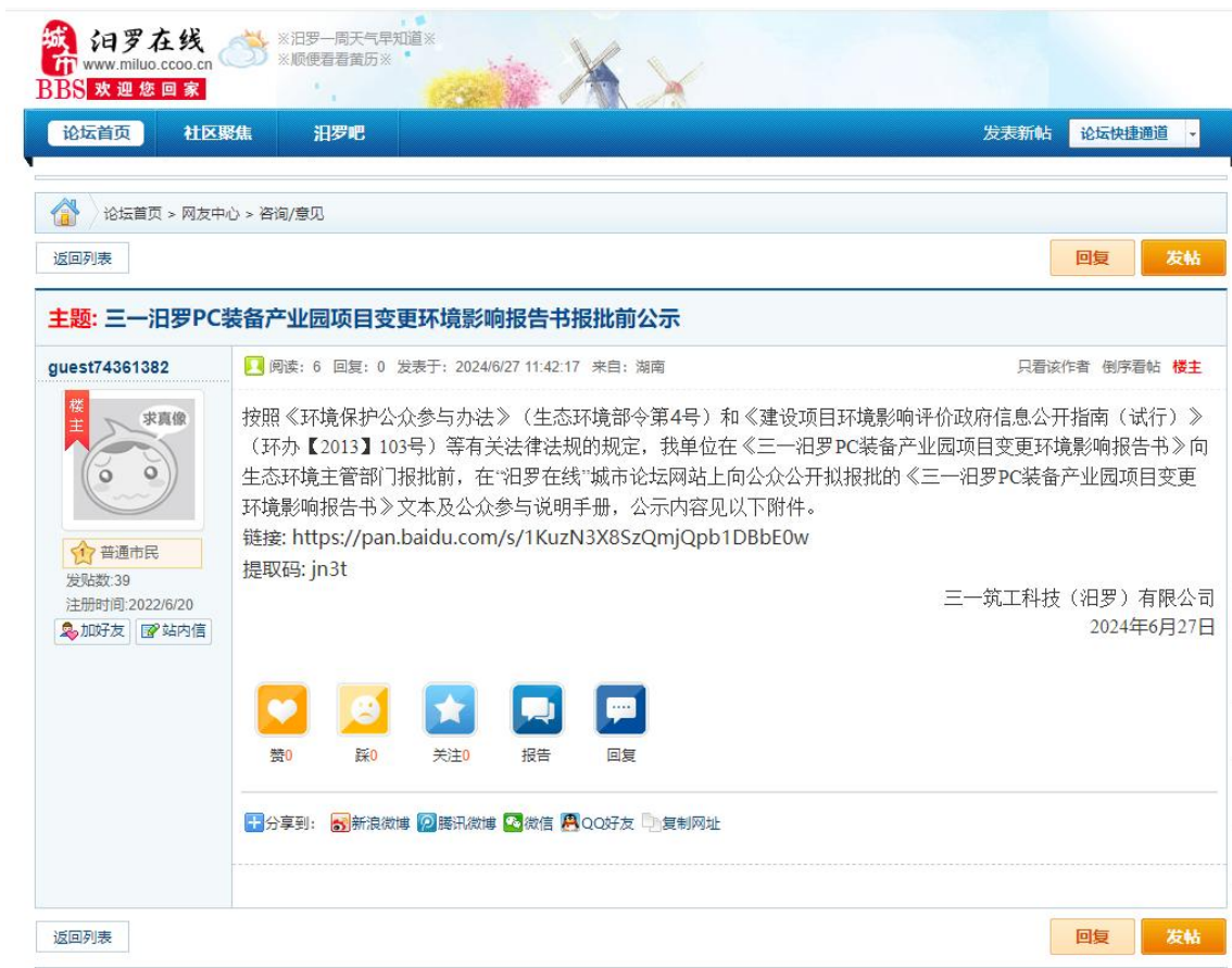
图 6 报批前公示

建设单位在环境影响报告书报批前，在“汨罗在线”上进行了报批前公示，公开了项目环评报告书及公参说明手册。